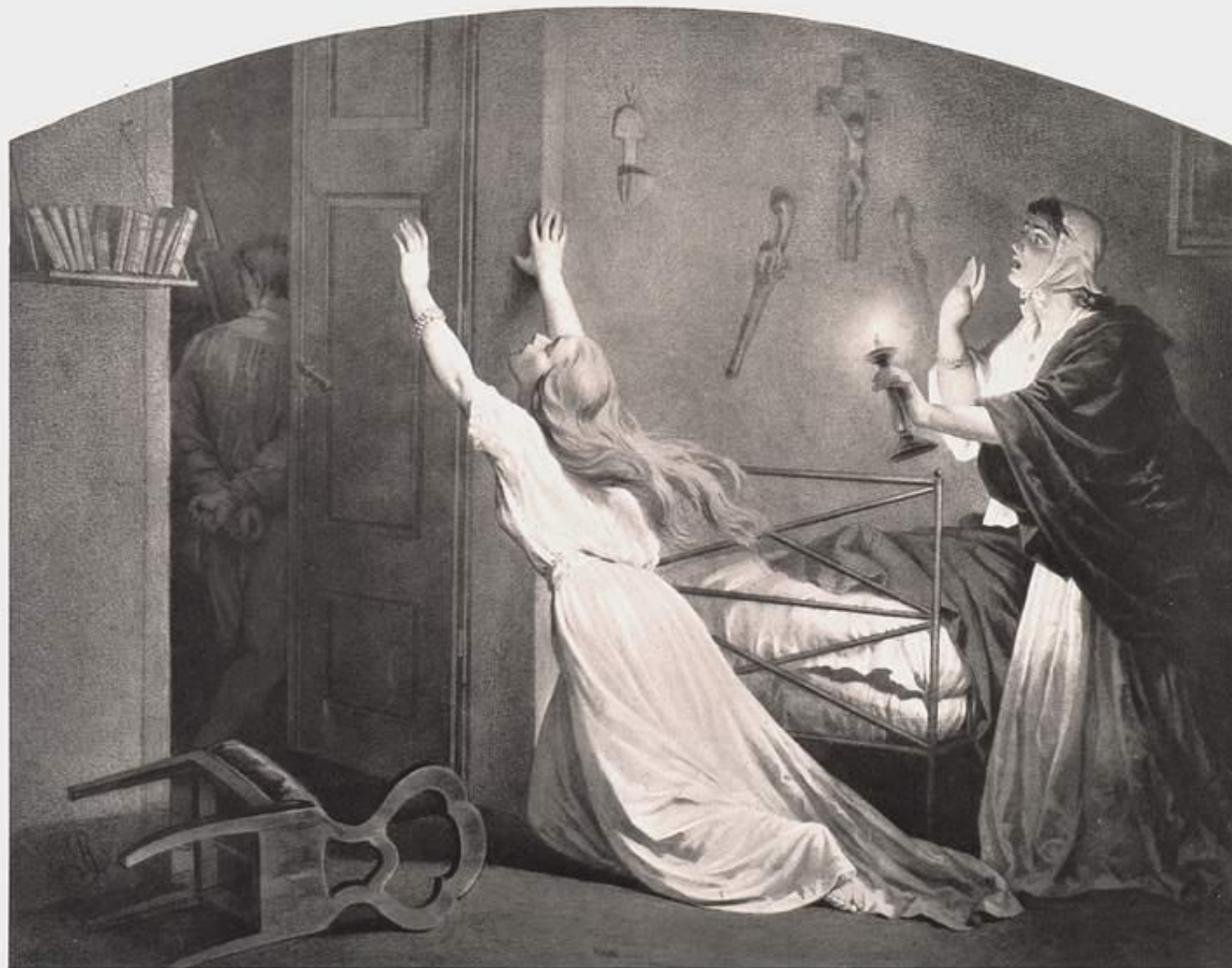
Branka, plansza 2 z cyklu Polonia, 1888 (1863), heliograviura