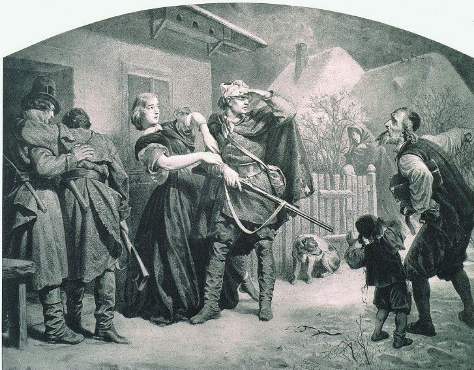
Schronisko rannych, plansza 5 z cyklu Polonia, 1888 (1863), heliograwiura