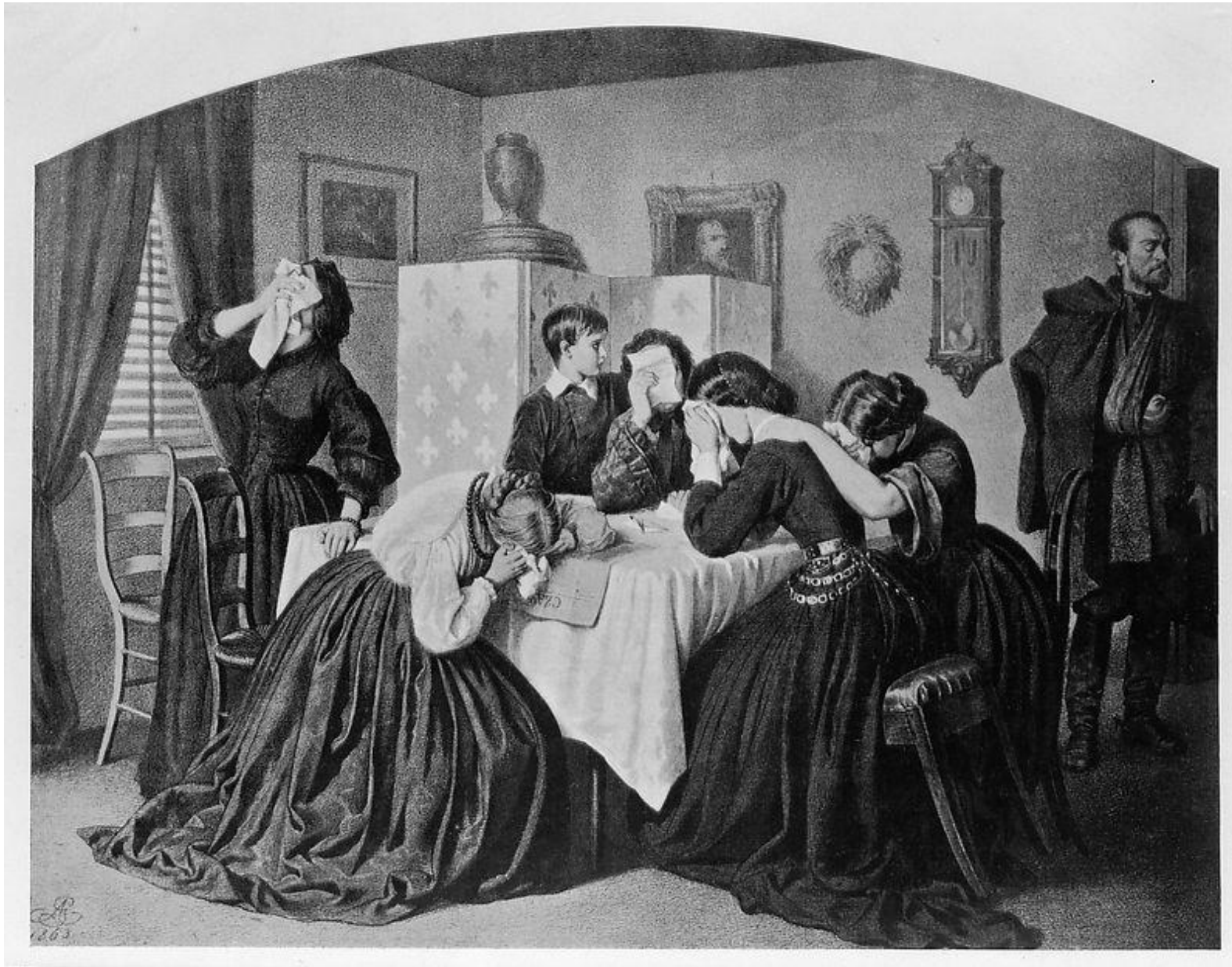
Żałoba, plansza 9 z cyklu Polonia, 1888 (1863), heliograwiura